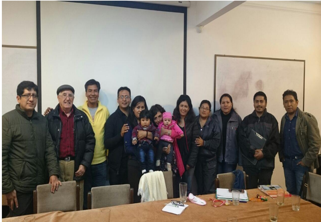
Parte de los participantes del Foro que asistieron al encuentro presencial generándose a partir de ello la Red de Apoyo

Precisamente el último módulo trato de la construcción de redes de apoyo mutuo para la organización e implementación de iniciativas de Turismo Comunitario.